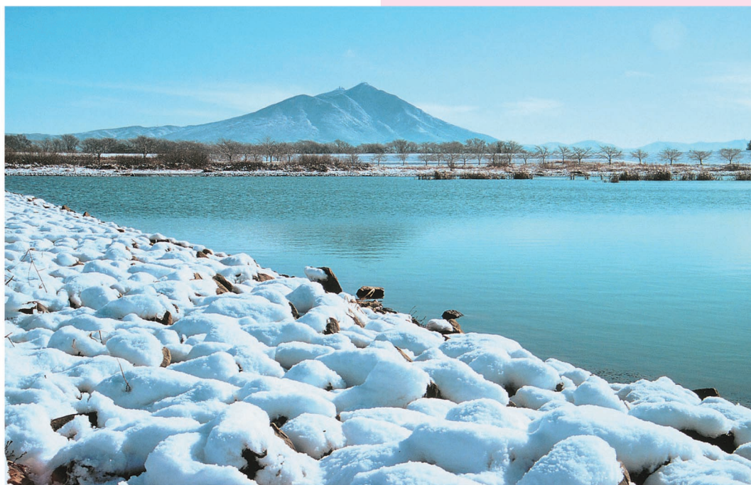
筑西市飯田地先から見た筑波山