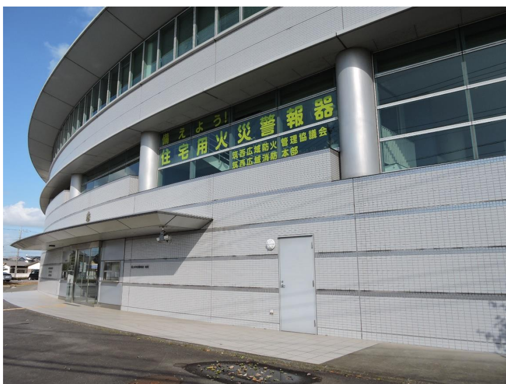
2 階窓下部分塗装工事（一部抜粋）