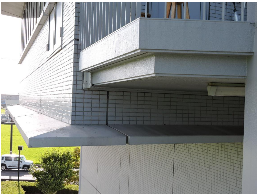
2 階窓上部分塗装工事（一部抜粋）