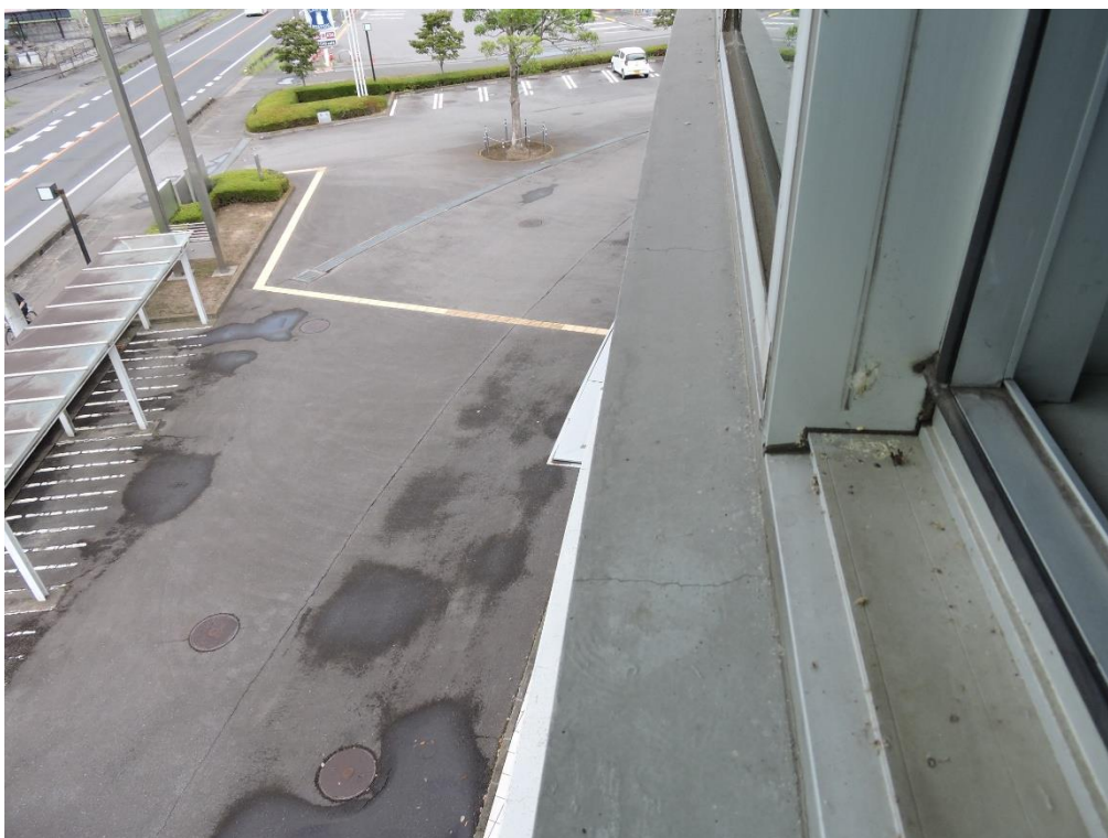
3 階窓下部分塗装工事（一部抜粋）