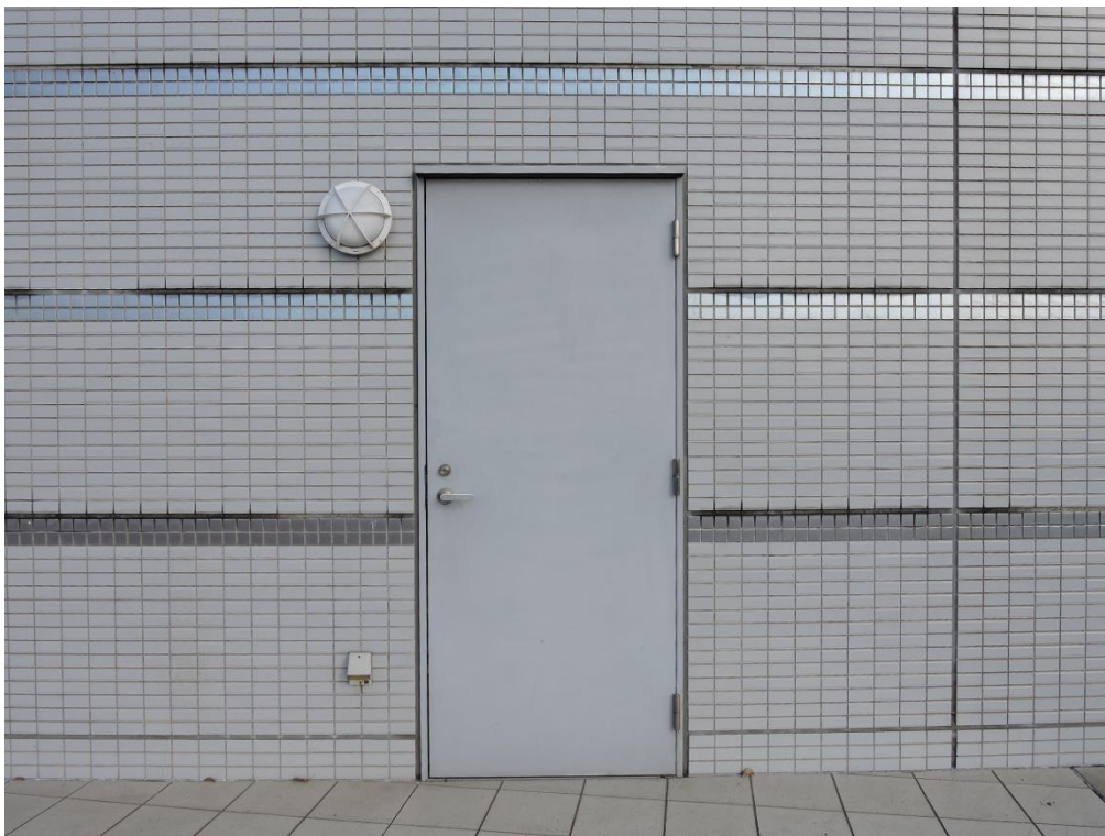
鋼製建具部分塗装工事（一部抜粋）