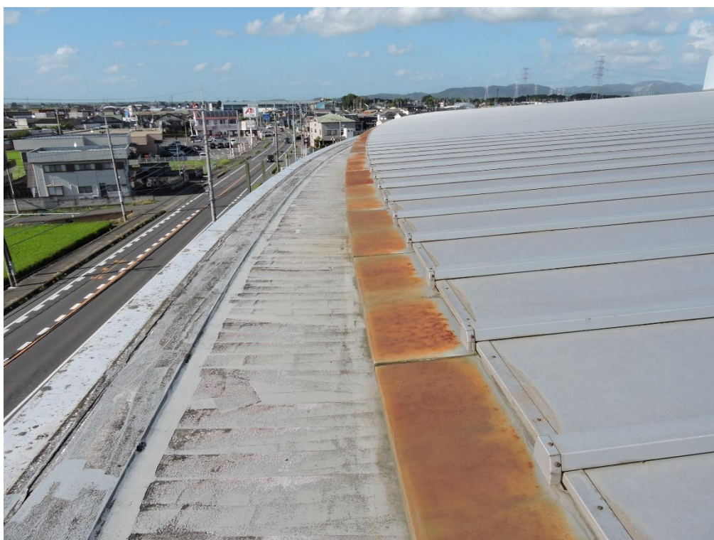
唐草部分塗装工事（一部抜粋）