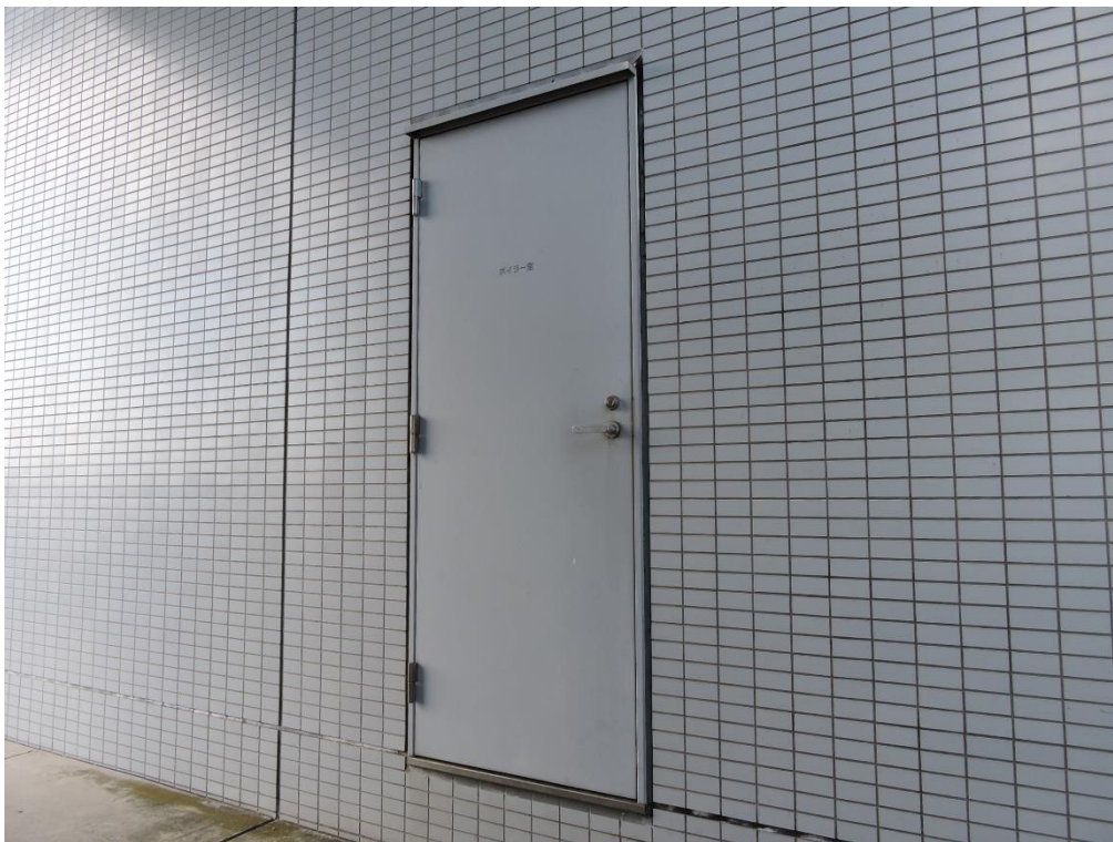
鋼製建具部分塗装工事（一部抜粋）