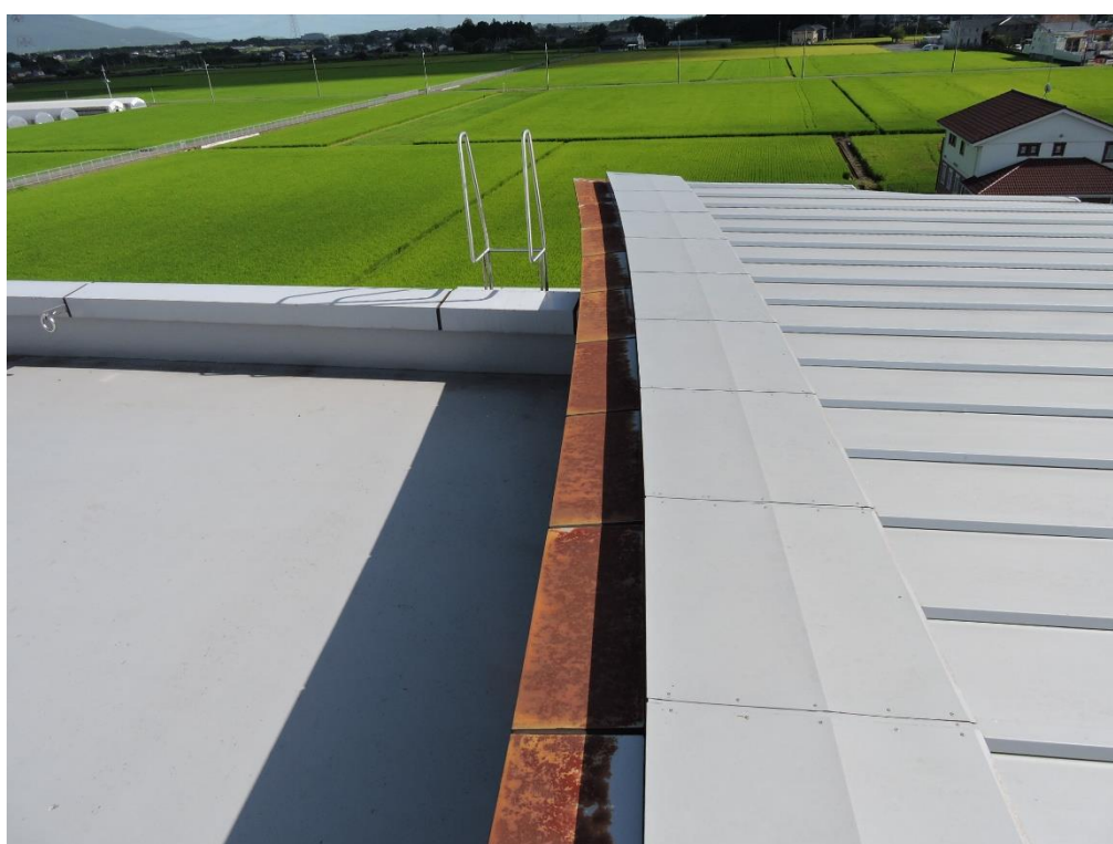
唐草部分塗装工事（一部抜粋）