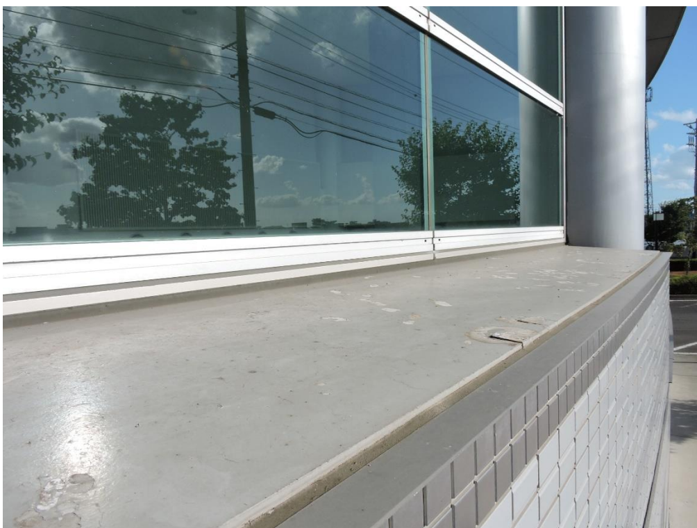
2階窓下部分塗装工事（一部抜粋）