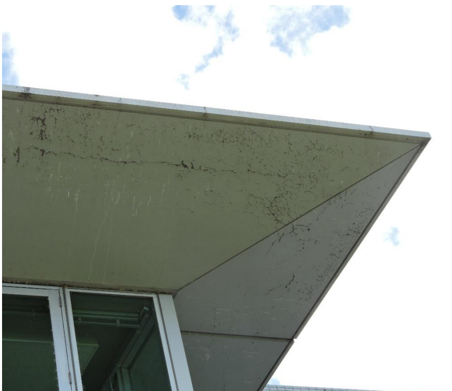
庇裏 PC 部分塗装工事（一部抜粋）