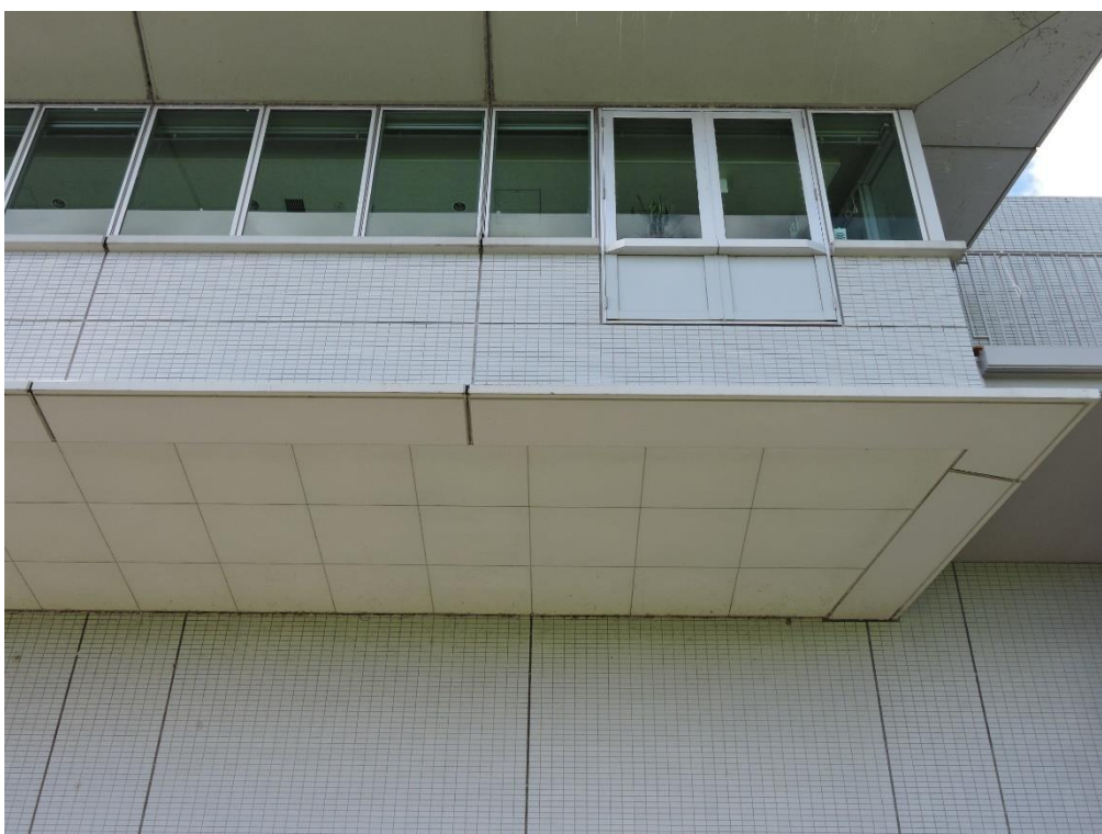
軒天部分塗装工事（一部抜粋）