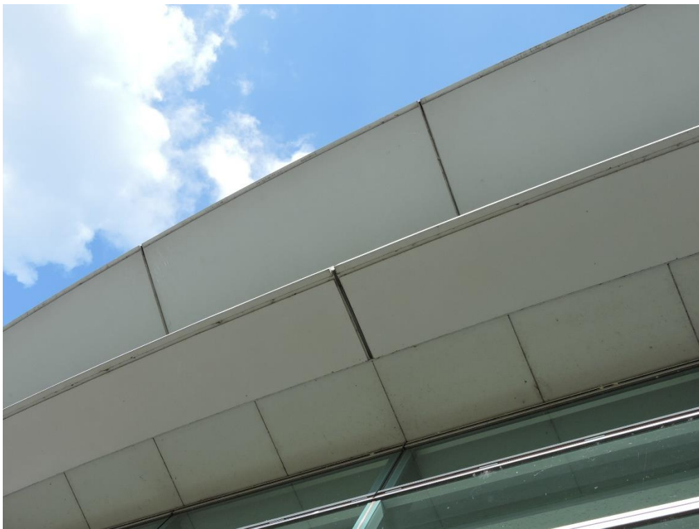
軒天部分塗装工事（一部抜粋）