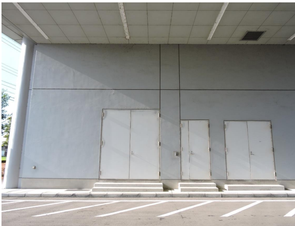
鋼製建具部分塗装工事（一部抜粋）