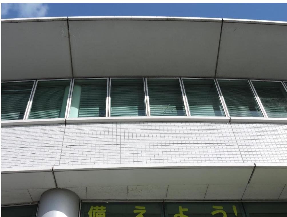
2 階窓上部分塗装工事（一部抜粋）