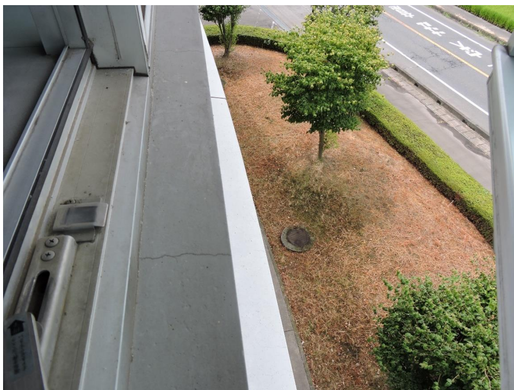
3 階窓下部分塗装工事（一部抜粋）