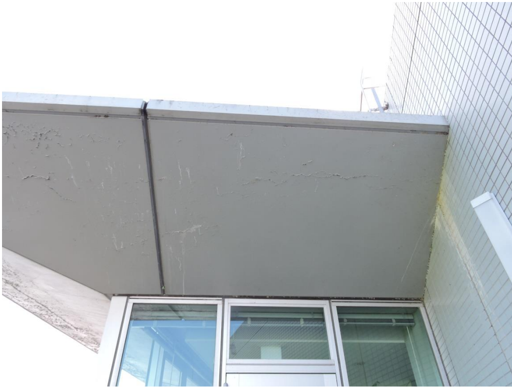
庇裏 PC 部分塗装工事（一部抜粋）