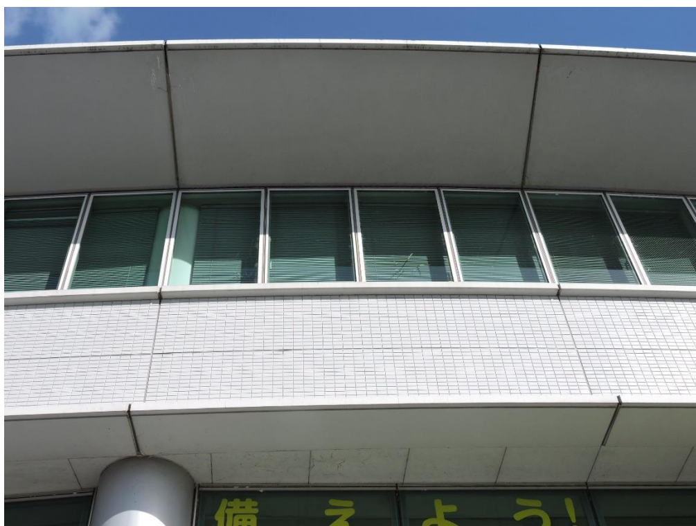
庇裏 PC 部分塗装工事（一部抜粋）