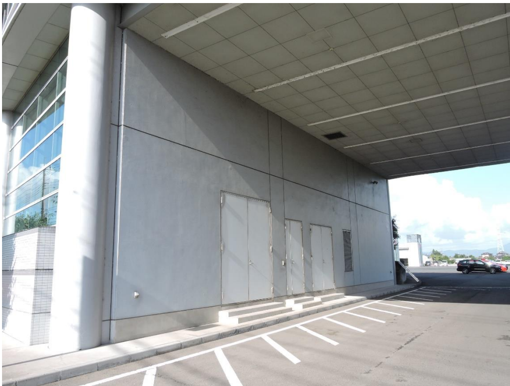
通り抜け通路壁部分塗装工事