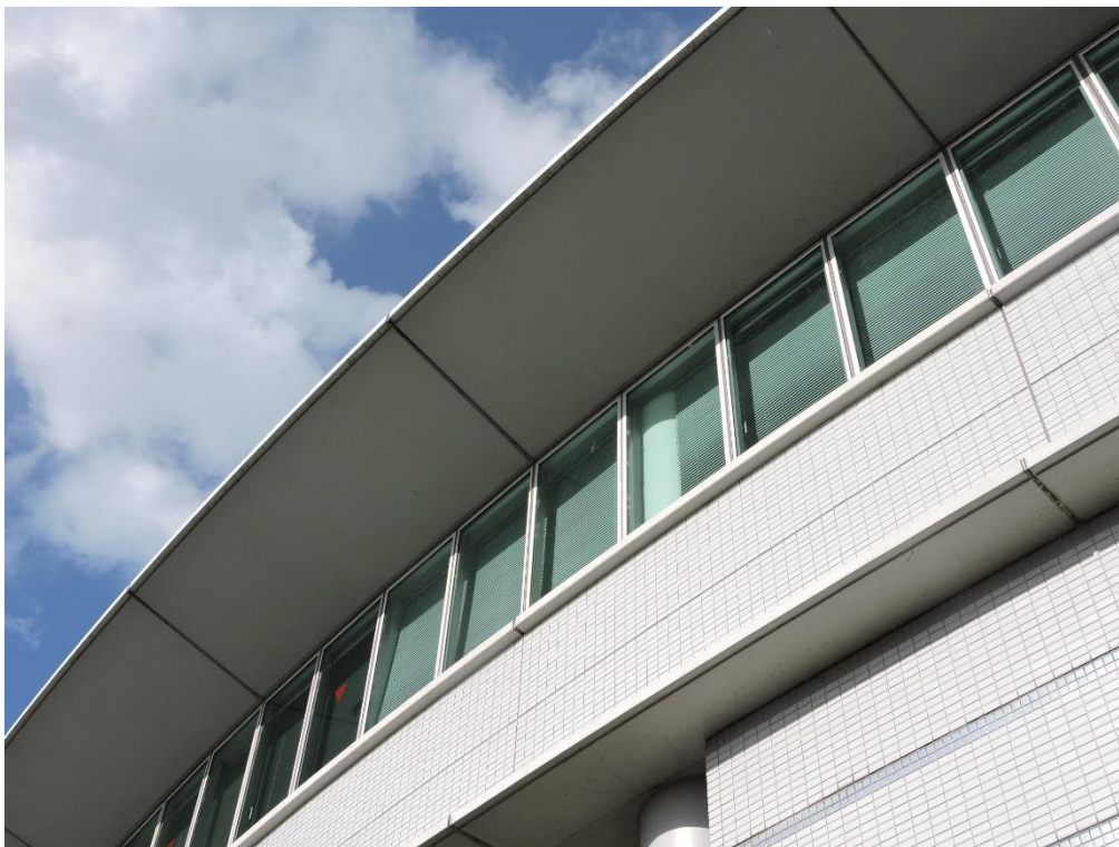
庇裏 PC 部分塗装工事（一部抜粋）