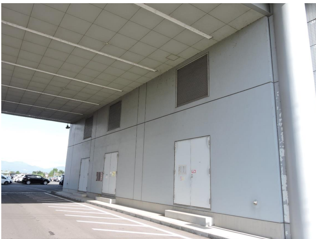
通り抜け通路壁部分塗装工事