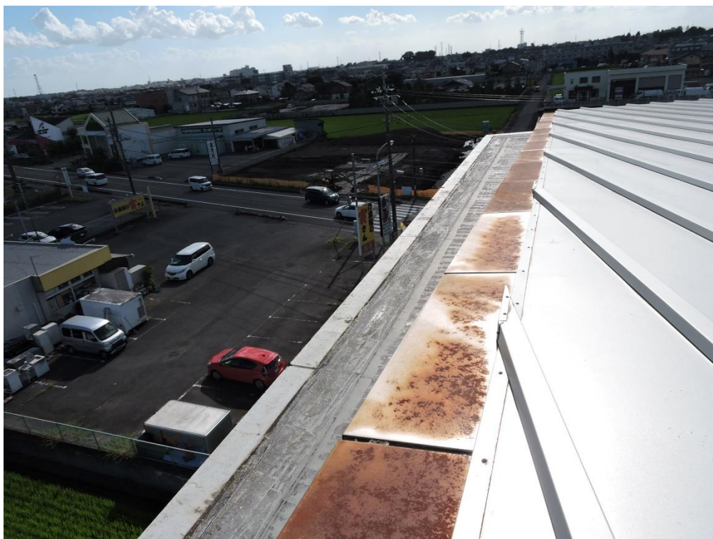
唐草部分塗装工事（一部抜粋）