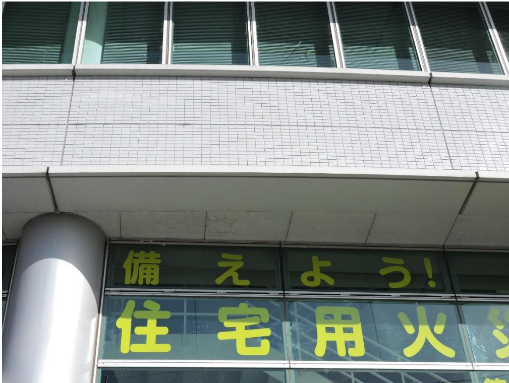
軒天部分塗装工事（一部抜粋）