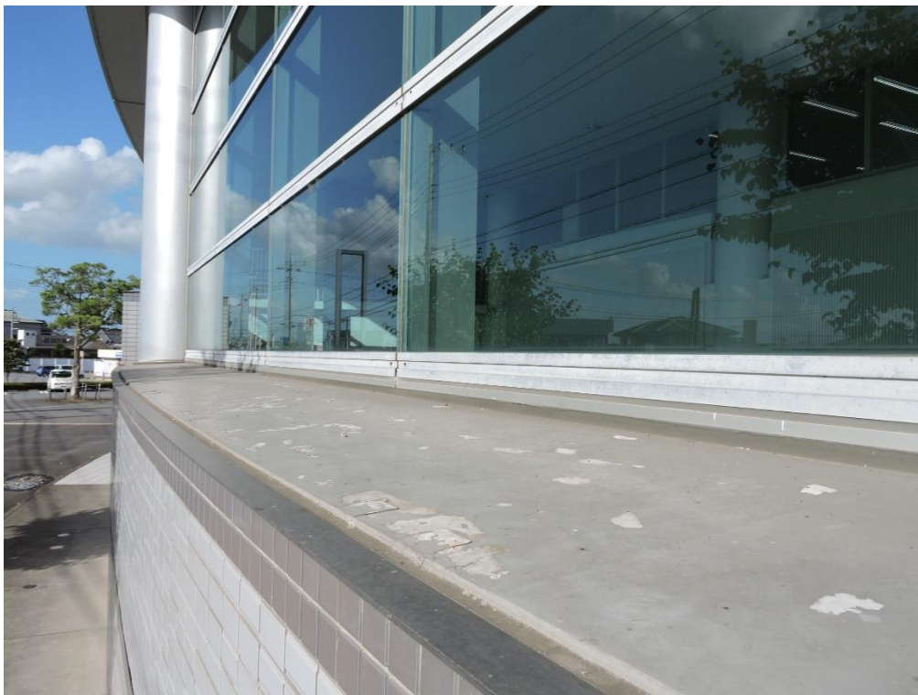
2階窓下部分塗装工事（一部抜粋）