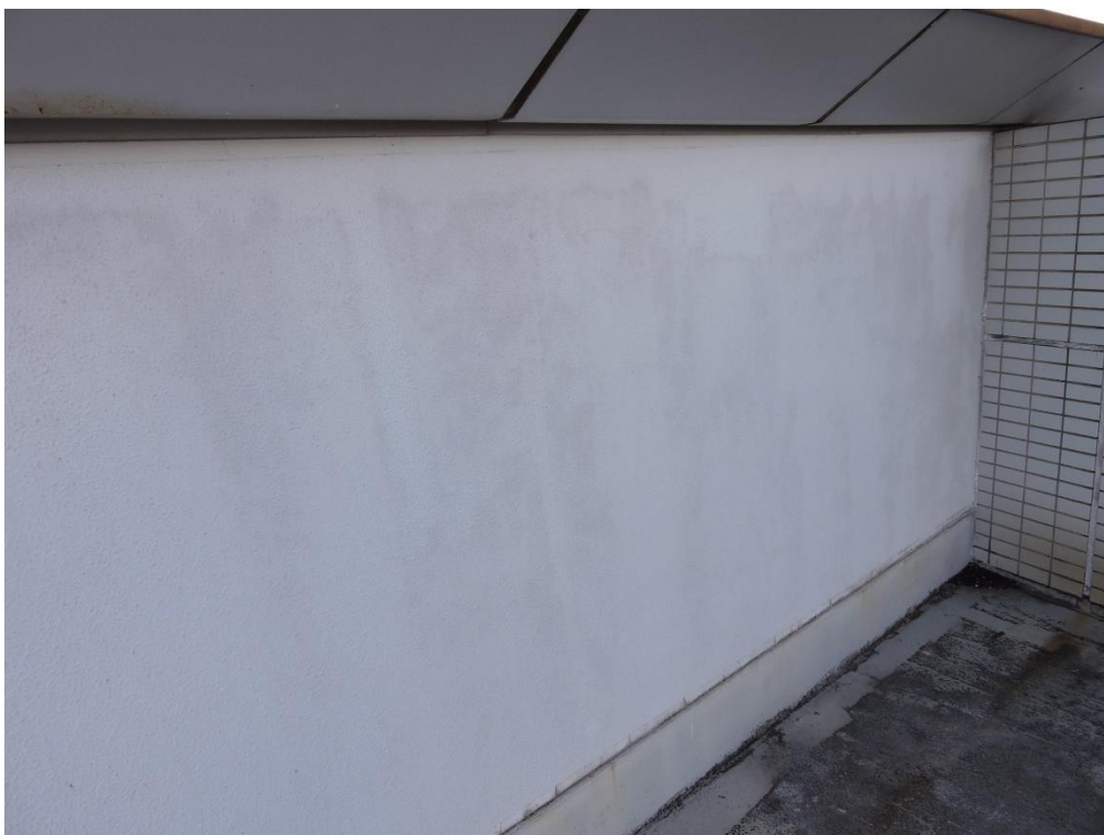
RC 庇上端壁立上り部分塗装工事