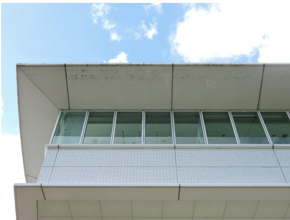
庇裏 PC 部分塗装工事（一部抜粋）