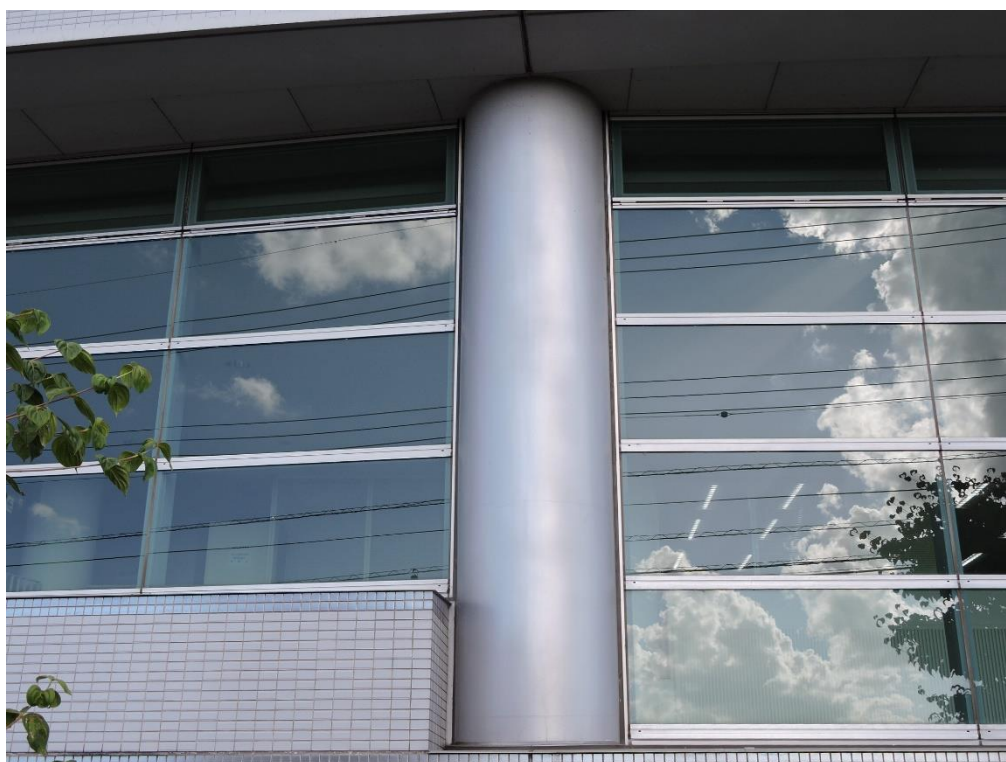
丸柱部分塗装工事（一部抜粋）