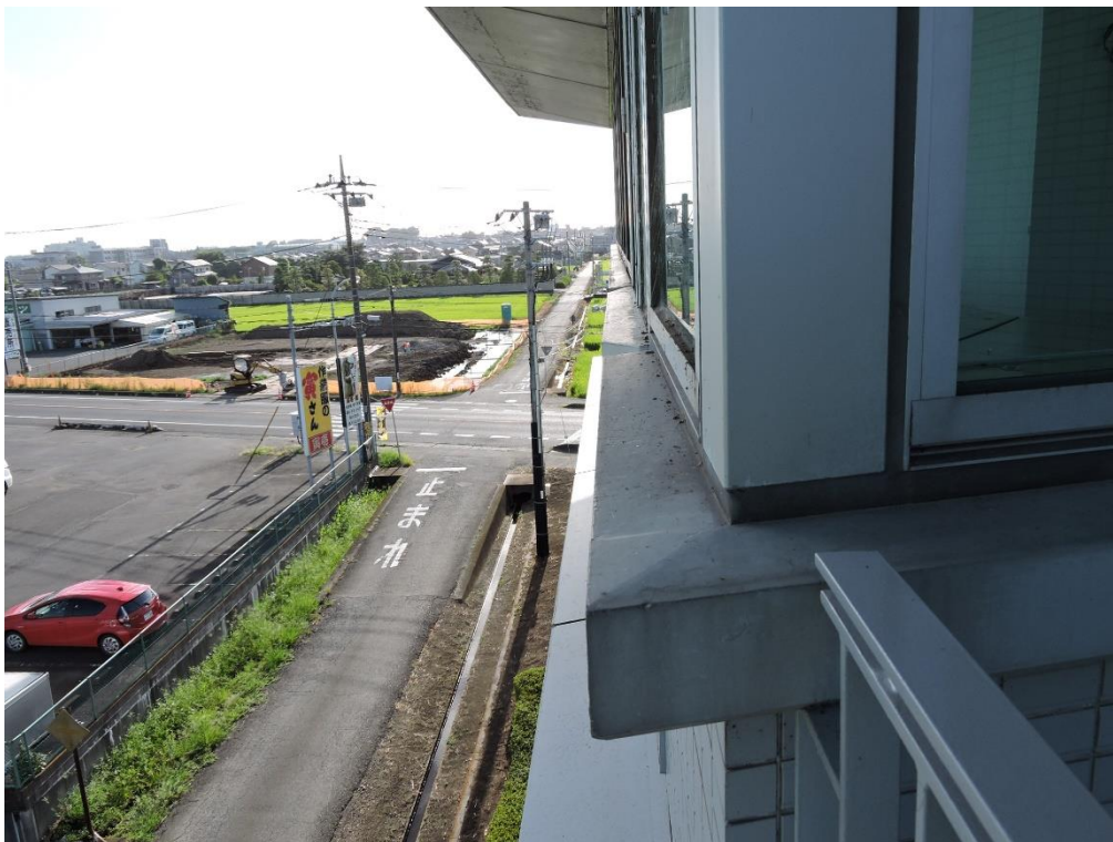
3 階窓下部分塗装工事（一部抜粋）