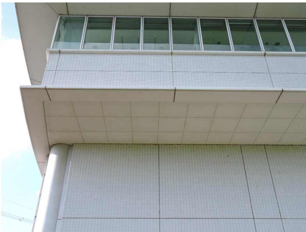
軒天部分塗装工事（一部抜粋）