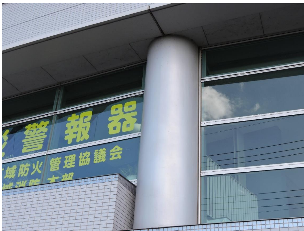
丸柱部分塗装工事（一部抜粋）