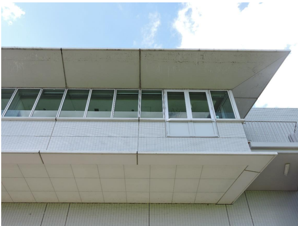
庇裏 PC 部分塗装工事（一部抜粋）