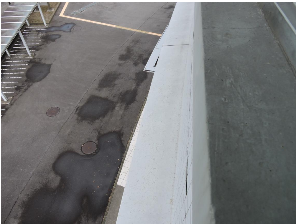
2階窓上部分塗装工事（一部抜粋）