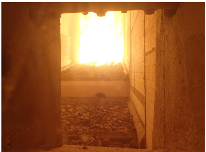
3号炉引渡完了運転中