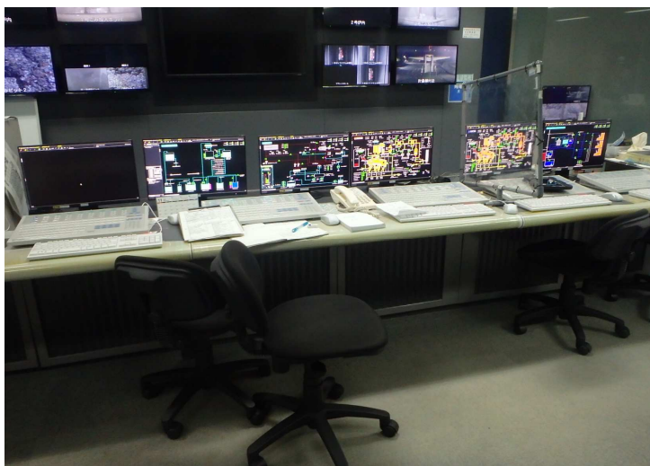
データ処理装置更新