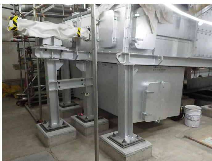
給じん装置据付け