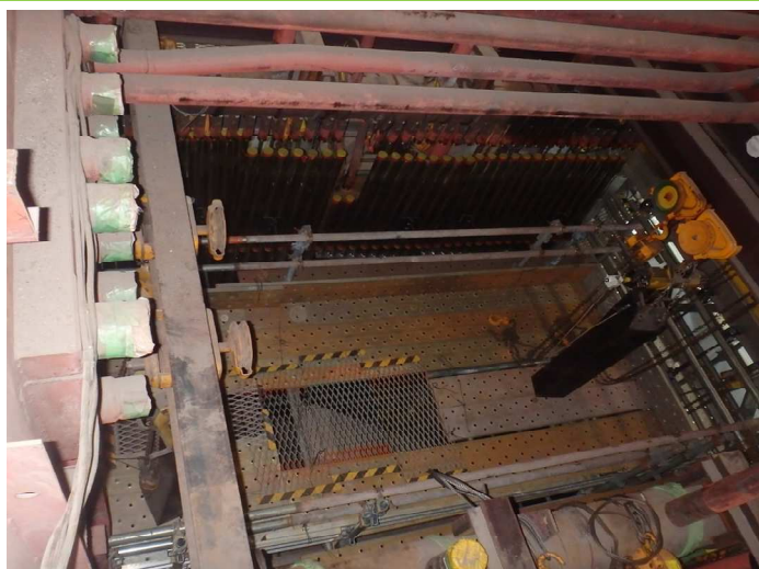
ボイラ（3パス）据え付け