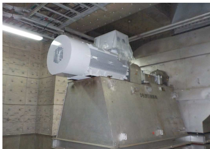
誘引通風機電動機据付け