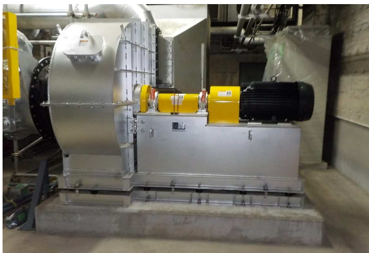
押し込み送風機据え付け