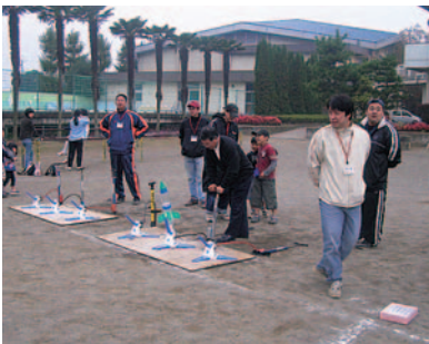
ペットボトルのロケットは大人にも人気