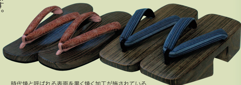
時代焼と呼ばれる表面を黒く焼く加工が施されている

気軽に履ける下駄が増えたからこそ重要なのが日常の手入れ。汚れた時はきつく絞った布で拭いて陰干しをしてください。左右を取り替えながら履くのも長持ちさせるポイント。桐下駄は、時代とともに進化を遂げてきた誇るべき伝統工芸。その火を絶やさぬためにも大切に履き続けたいものです。