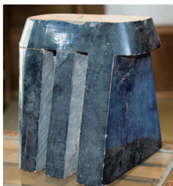
歌舞伎で使う「花魁下駄」など、芸能文化においても桐下駄が活躍