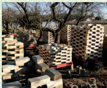
製材した桐材を、梅雨の雨であく抜きした後、乾燥させる「木取」