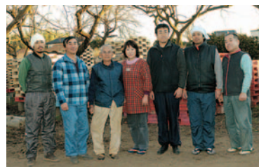
親子三代で桐下駄作りを続けている、猪ノ原桐材木工所の皆さん