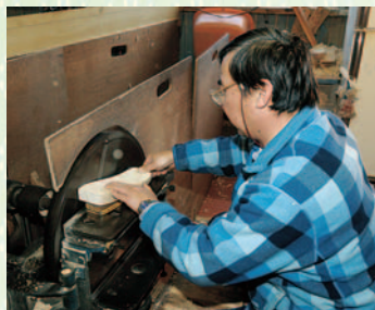
下駄の形は、桐材の角を丸める「鼻廻し」によって決められる