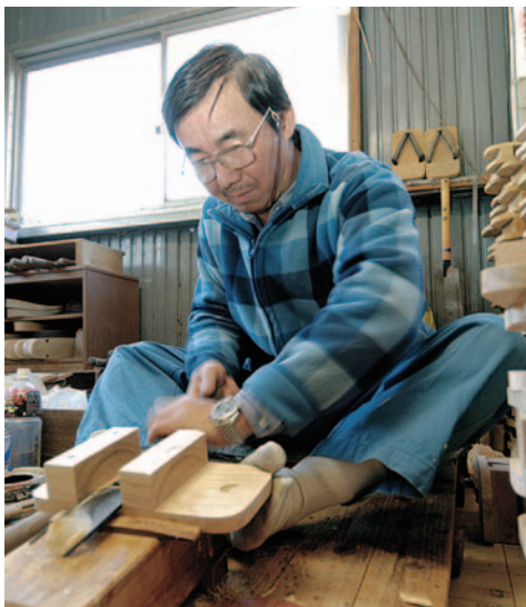
形が決まった桐材は、手作業による様々な工程を経て仕上げられる

かつて結城地方にあった桐下駄の製造工場は約60軒。その後、若者の和装離れなどによつ