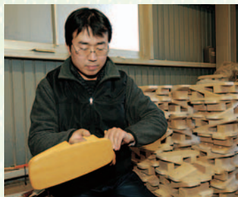
製品にとのこを塗り、光沢が出るように磨き上げて完成となる