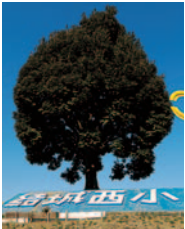
「くすのきやま」は結城西小のシンボル