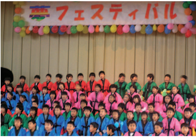
昨秋のくすのきまつりのテーマは「夢」

同校では、毎年秋季に「くすのきまつり」と題した学校祭が催されています。児童はこのお祭りを楽しみにしており、早い時期から実行委員会を組織し、全児童に呼び掛けて活動を盛り上げていきます。昨秋は「夢」をテーマに、「夢