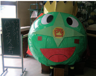
昨秋のマスコットキャラ「ハピネスくん」