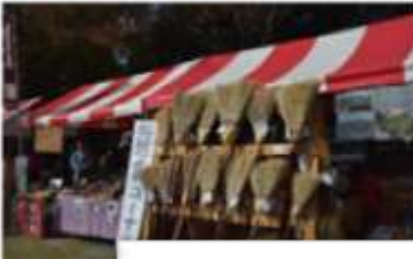
桐下駄・和ぼうき

B-8グルメをはじめ、物産店や和ぼうきの実演など、地元の方の協力の下、様々なブースを出店していただきました。