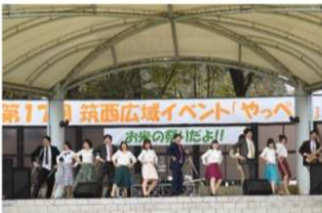
劇団明野ミュージカル