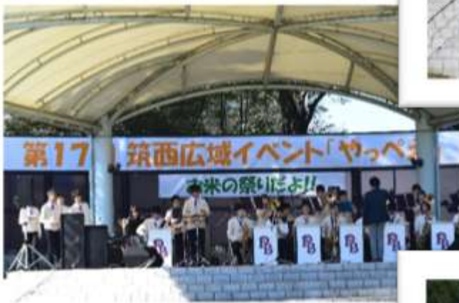
下館工業高校 JAZZ BAND 部