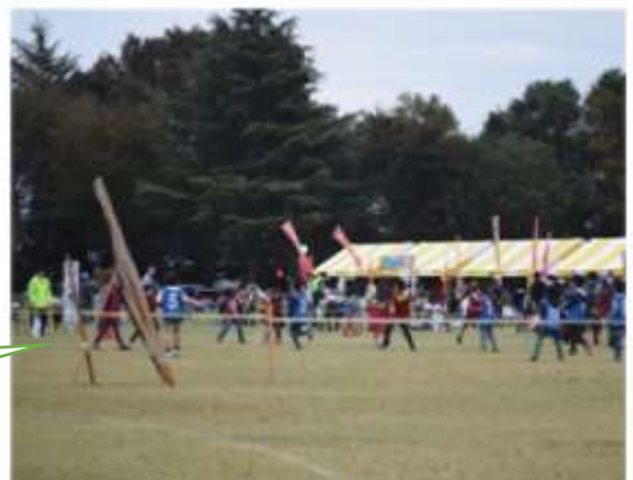
スポーツ鬼ごっこ