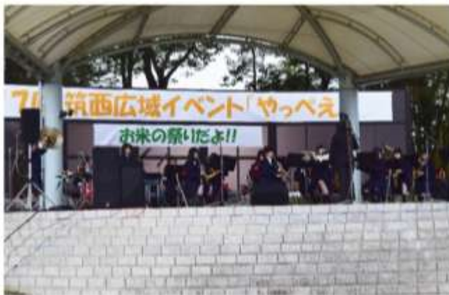
下館第二高校 吹奏楽部

3市で活躍する団体の皆さまが、音楽やダンス、ミュージカルなど素晴らしいパフォーマンスを披露しました。